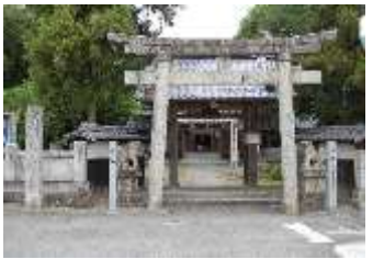
《周布文化財保護委員会》

祭神は天日靈貴神、高産靈神、神産靈神、豊受姫神、武内宿将である。顕宗天皇時代の3年阿閉臣事代(487年)創祀と伝えられている。古くは徳威神明宮とっていたが平安時代の元慶三年応神天皇を勧請して徳威八幡宮と号し、勅使八幡宮とも言われている。戦国時代、石根の剣山城主が産土の神として崇め毎年米を寄進していた。天正の陣後社運は衰えたが小松藩の成立により藩主一柳直頼公が徳威神社を再興した。源頼義から雨乞いの功により「天の下 治まる社の徳威にてめぐみへだてぬ神ぞこの神」の和歌とともに土地70町歩の寄進を受けた。