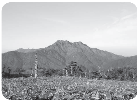
瓶ヶ森から石鎚山を望む