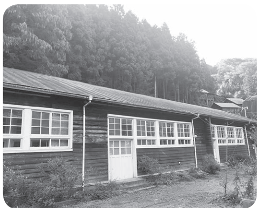
整備予定の研修宿泊棟

A 研修宿泊棟は、宿泊機能を兼ねる研修施設として位置付け、ケビン棟で宿泊がまかないきれない場合に宿泊するなど、必要に応じた運用を考えており、施設全体で宿泊者数の2割増を目標としている。