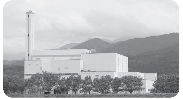
道前クリーンセンター

答 平成30年度中に道前クリーンセンター施設整備基本構想などを策定することとしており、基本的な方向性やスケジュールについては、この基本構想の中に盛り込むこととし、現在、検討を行っている。