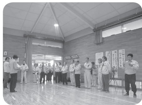
西条北中学校武道場の調査