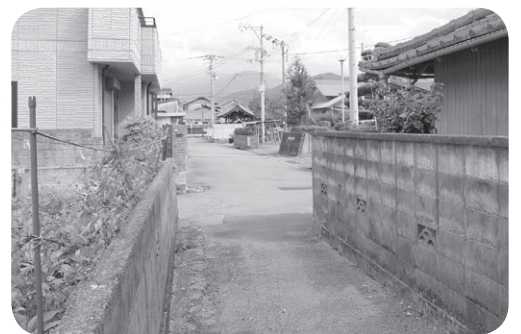
市道小松温芳図書館北線