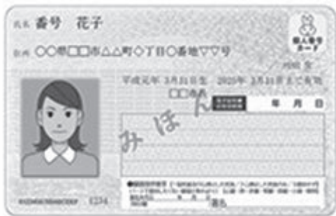
個人番号カード 見本

A 国による女性活躍のための基盤整備の一環として、住民票や個人番号カードに旧姓を併記できるようシステムを改修するものである。平成30年7月31日現在における個人番号カードの交付数は8千304枚で、交付率は7.5パーセントである。