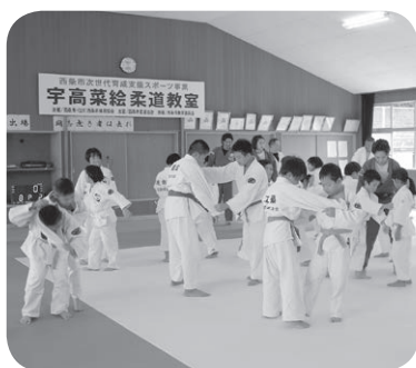
次世代育成支援スポーツ事業(柔道教室)

に、対象年齢層に応じて、きつかけづくり、ステップアップ、競技力向上の3段階に体系化した各種スポーツ教室やスポーツイベントを実施している。これまで17種目のスポーツ教室に毎年約千人の小・中学生が参加しているほか、競技力向上継続トレーニングに年間約千人が参加している。スポーツ合宿推進事業では、本市での合宿実績を持つ団体の継続実施を確保するとともに、新規団体の誘致を積極的に進めることでスポーツ交流人口の増加を図っており、過去10年間で延べ約8万人が本市で合宿を行っている。