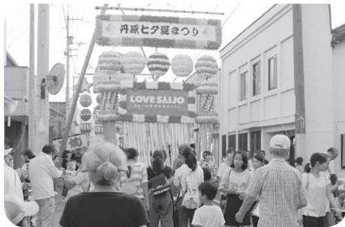
惜しまれつつ幕を閉じた丹原七夕夏まつり

丹原七夕夏まつりや丹地区米まつり・魚まつりなど、地域の文化を支えてきた催事が終わるのは残念との声を多く聞くが、今後の催事の在り方について、どう考えるか。