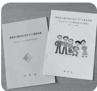
人権文化のまちづくり基本計画

人権三法の成立を受け、市民向けの既存講座に人権三法の内容を取り入れるとともに、年3回の部落問題集中講座を新規開講している。西条市人権文化のまちづくり基本計画は、策定後10年が経過しており、時代の流れとともに新たな人権課題が出ていることから、市としても見直しの必要性を感じている。基本計画の見直しに当たっては、平成31年度に実施する市民の人権に関する意識調査から、課題を見いだし、計画に盛り込むべきであると考えている。また、基本計画作成における議論の中で、西条市人権文化のまちづくり条例の内容についても精査したいと考えており、合わせて、人権三法を踏まえた新たな条例制定の必要性についても検討したい。