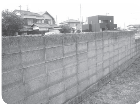
倒壊の危険性があるブロック塀

ブロック塀の改修に対する 補助については、今後、国の 動向を注視しながら、対応を 検討していきたい。