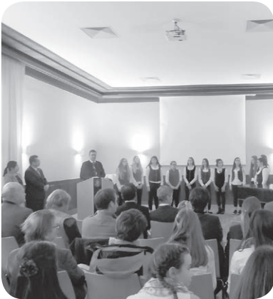
セーボーデン市での交流の様子

A 本市は、2020年東京オリンピック・パラリンピック競技大会におけるオーストリア国のホストタウンに登録され、文化・経済などの交流を深めることになる。セーボーデン市との交流については、10月にセーボーデン市長が来西した際に、両市長間で協議することになっている。