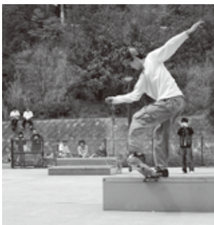
▲昨年のコンテストの様子

■参加資格 中学生以上 ■参加料 1000円 ■問合せ 伊予小松ライオンズクラブ事務局 TEL0898-172-4454 URL http://www18.ocn.ne.jp/~komatuc/