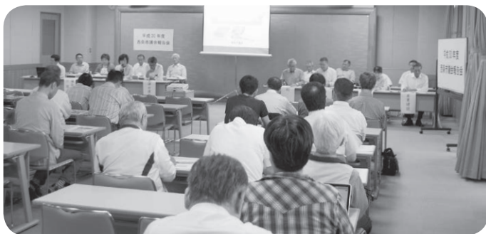
西会場：東予総合福祉センター