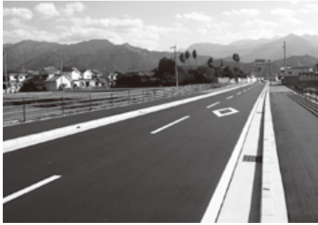
▲古川樋之口線改良事業