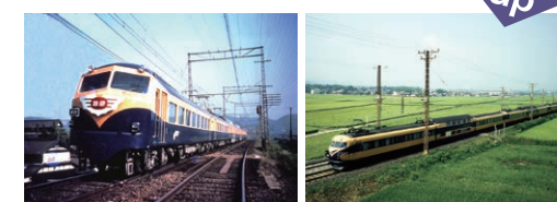
▲ビスタカー(左)と新ビスタカー(右)

期間 8月3日(金)～19日(日) 場所・問合せ 佐伯記念館・郷土資料館 TEL0898-68-4610