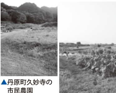
▲丹原町久妙寺の 市民農園