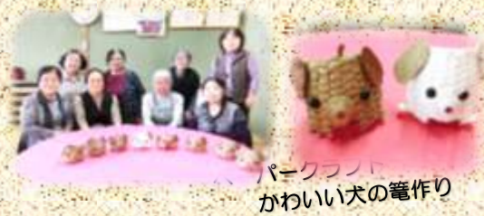
パークフット かわいい犬の製作