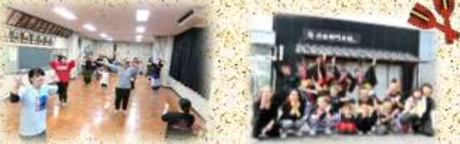
よさこい踊り教室の皆さんが祭彩華の皆さんと 一緒に地域のイベントに参加しました