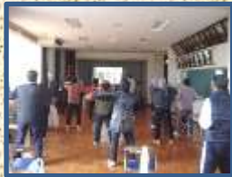
歌に合わせて 1・2・1・2・・・