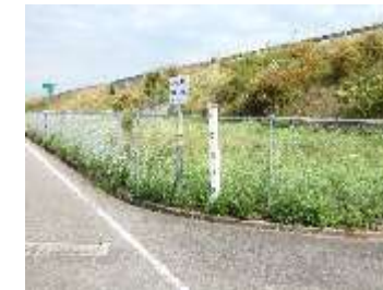
《周布文化財保護委員会》

昔、鴨之窪観音道の傍らに大きな猿塚が作られていた。 猿に似た石があり通る人を化かしたり脅したりして村人を困らせていたため、鴨之窪の人々が猿石の霊を鎮めるため大きな猿塚を作ったが、猿石のいたずらは治まらなかったと言われている。