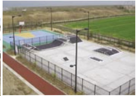
▲スケートボード場（手前） 3on3バスケットコート（左奥）