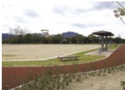
▲広場とジョギングコース

【施設利用についてのお問い合わせ先】 東予運動公園 TEL0898-66-0361