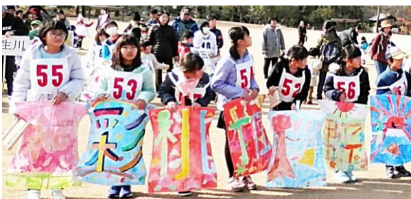
自慢の凧が勢ぞろい

1月6日(土)、東予運動公園多目的広場で西条市愛護班連絡協議会主催による子ども凧あげ大会が開催されました。子どもたちは、自分の作った凧を、最後には空高く舞い上げていました。吉井地区愛護班は団体賞と2人が個人の賞を獲得しました。