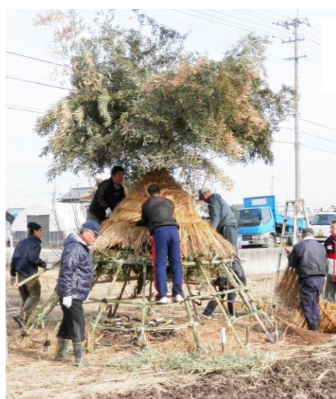
今在家地区の とうどうさん

1月14日(日)「とうどうさん」のはやし(燃やす)が各地区で行われました。この火にあると病気をしない、災難にあわない、と言われていました。今年も地域から多くの人たちが集まりました。