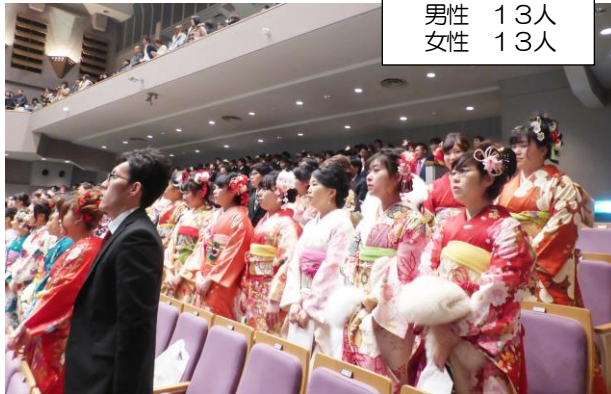
吉井地区新成人 男性 13人 女性 13人

1月7日(日)、丹原文化会館並びに総合文化会館で平成30年西条市成人式が挙行され、振袖やスーツ姿の新成人が、久しぶりに再会した同級生との話に花を咲かせながら、記念撮影をしたりと、笑顔あふれる華やかな雰囲気会場が包まれていました。