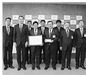
▲感謝状が贈呈されました

住友重機械労働組合連合会愛媛地方本部から、市内の小・中学校へ図書カードが寄贈されました。1987（昭和62）年度から毎年寄贈いただき、学校図書の実に貢献していただいています。