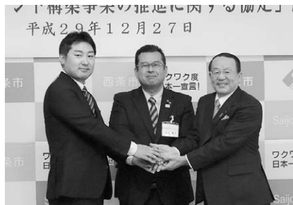
▲締結式で握手を交わす野池社長（左）、玉井市長（中央）、本田頭取（右）