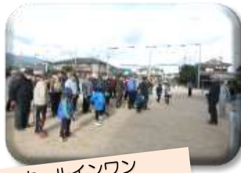
ホールインワン たくさん 出ましたよ!!