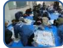
高く飛びますように・・・