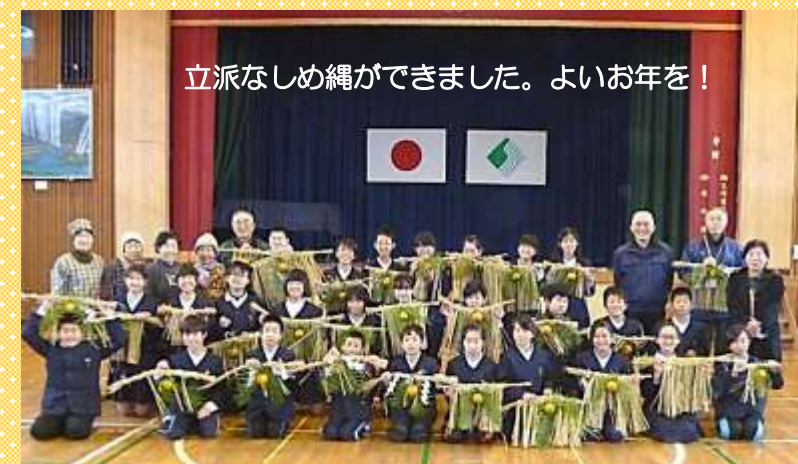
立派なしめ縄ができました。よいお年を!

小学5・6年生を対象に禎瑞共楽会のみなさんに教えていただきました。ありがとうございました!