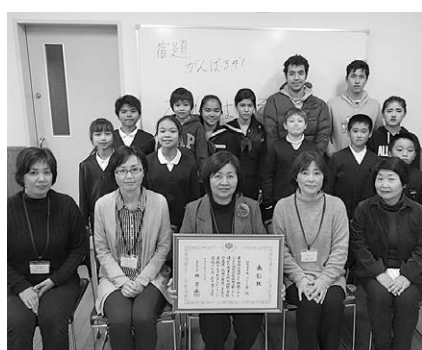
▲地域未来塾「さくら塾」の皆さん

さくら塾では、日本語に不慣れた外国人の子ども一人一人に宿題や予習復習、日本語などの学習指導のほか、日本での基本的な生活習慣の修得、保護者への学校活動支援などを、学校と連携しながら行っています。支援員は日本語指導法の研修にも努めており、子どもたちの学習意欲や表現力、学力の向上が見られるとともに、地域交流活動を通して地域との人間関係や信頼関係も育まれ、子どもたちがのびのびと育っています。