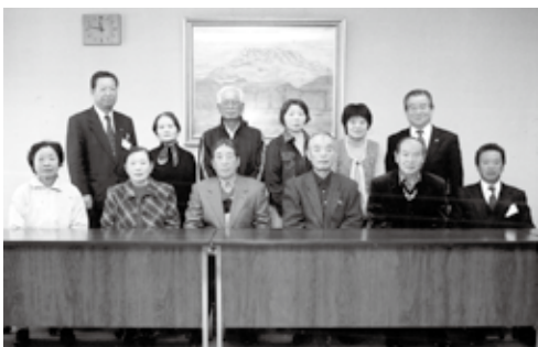
▲おめでとうございます。