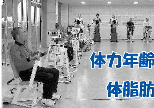
◀総合福祉センターでの運動教室の様子

中央保健センター TEL0897-52-1215 神拝甲324-2 総合福祉センター内 東予保健センター TEL0898-64-5333 周布606-1 東予総合福祉センター内 丹原保健センター TEL0898-68-7300 丹原町池田1762-1 丹原総合支所北隣 小松保健センター TEL0898-72-6363 小松町新屋敷乙48-1 小松地域福祉センター内