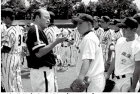
▲次世代育成支援スポーツ事業

市では、皆さんに市の財政状況を知っていただくため、年に2回、各会計の執行状況などを公表しています。今回は、平成17年度上半期（4月1日から9月30日）の財政状況について、お知らせします。