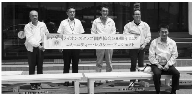
▲伊予小松ライオンズクラブの皆さんと寄贈されたベンチ

伊予小松ライオンズクラブは、小松地区を中心に活動している社会奉仕団体です。駅前や遍路道の清掃の