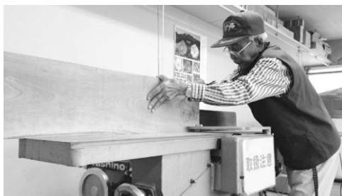
▲今日も元気に製作中！

丹原農村環境改善センターの木工室には、本格的な木材加工設備が整っています。木材の加工活動を通じて地域社会に貢献し、会員相互の親睦を深め、健康で