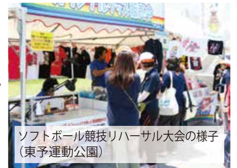
ソフトボール競技リハーサル大会の様子 (東予運動公園)