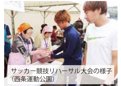
サッカー競技リハーサル大会の様子 (西条運動公園)