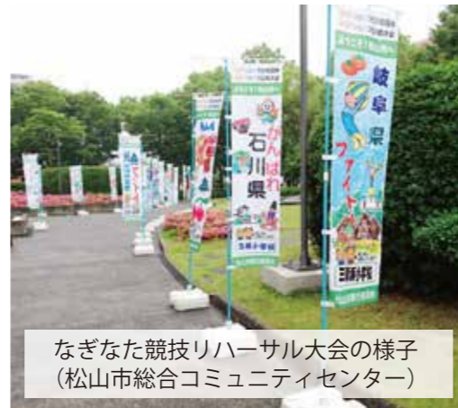
なぎなた競技リハーサル大会の様子 (松山市総合コミュニティセンター)