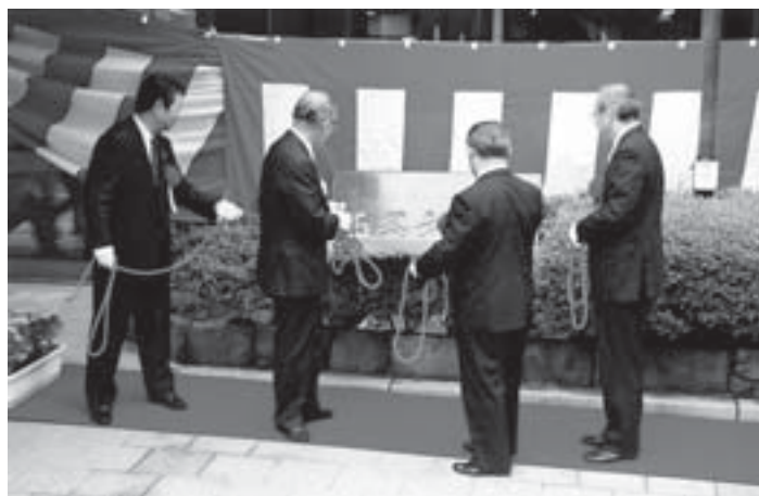
▲前4市町の首長が、西条市役所の石碑の除幕を行いました。