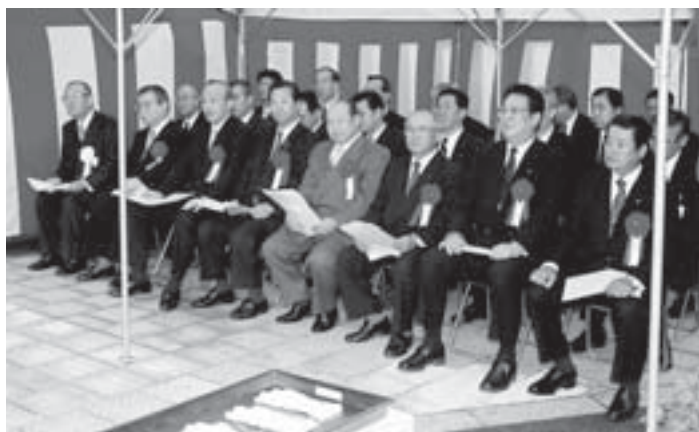
▶開庁式には、前4市町の首長・議会議長や職員が出席しました。

午前8時から市役所庁舎で開庁式が開催されました。開庁式には、前4市町の首長・議会議長や職員が出席し、石碑の除幕やテープカットを行い、新しい市の門出を祝いました。開庁式の最中には、道行く市民のみなさんも足を止め、新市スタートの瞬間を一緒に喜び合いました。