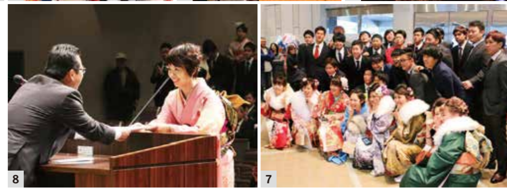
1_会場中にあふれる笑顔 2_雨の中、笑顔で再会を喜ぶ 3_近藤さんと佐藤さんは成人の主張を漫才で表現 4_代表の皆さんによる堂々とした成人の主張や謝辞 5_スマートフォンで自撮りする新成人たち 6_友達と一緒に写真に納まる 7_多くの仲間が集まり記念撮影 8_謝辞の後、笑顔で玉井市長と言葉を交わす