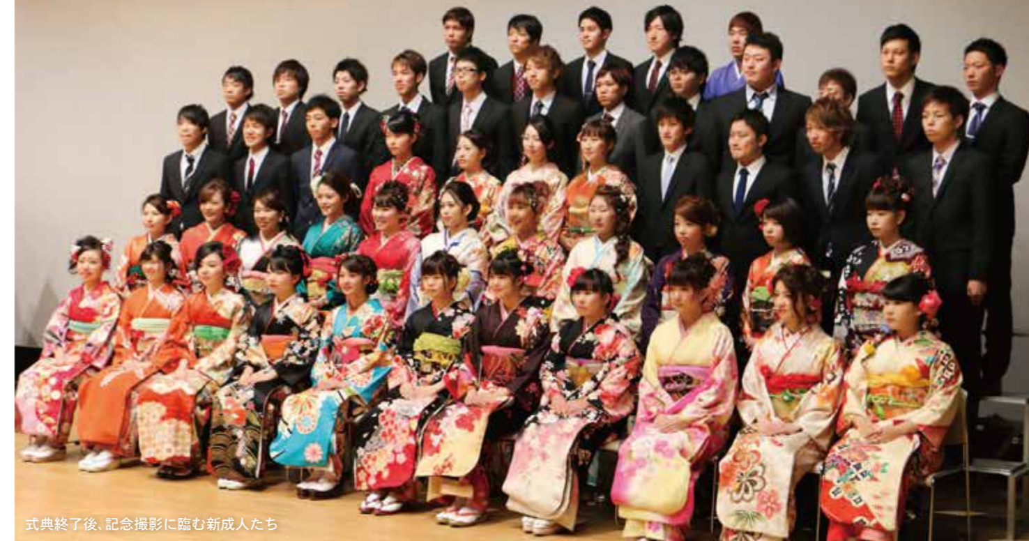
式典終了後、記念撮影に臨む新成人たち