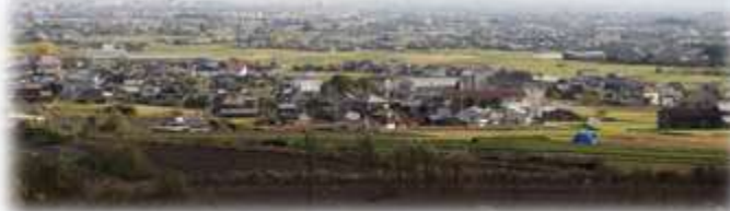
西条市内を一望 見事な景色！

1824年に再建。 10月末から11月初旬に裏庭には石路（つわ）の花が咲き、つわの寺とも呼ばれています。