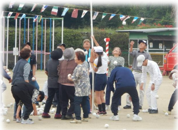
▲熟練の技を見せてくれました。