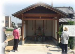
⑥開きのお地藏さん

JR予讃線が典型的な天井川である大明神川を渡るとき、「川の下」を走ります。全国的にも数例しかない川底を走る鉄道トンネルです。(全長65m)