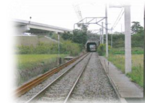
⑤大明神川トンネル

三島神社は「おみしまさん」の名で親しまれ、三芳村鎮守の氏神様です。本殿前石灯籠は大明神川氾濫の被害を今に伝えるものとして知られています。洪水により流出したため、中台には鳥居の石柱が代用されています。