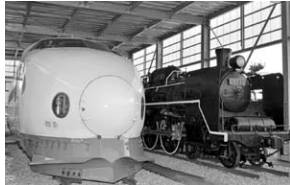
▲新津鉄道資料館の200系とC57