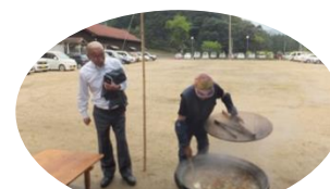
金吾さんはし鍋を準備