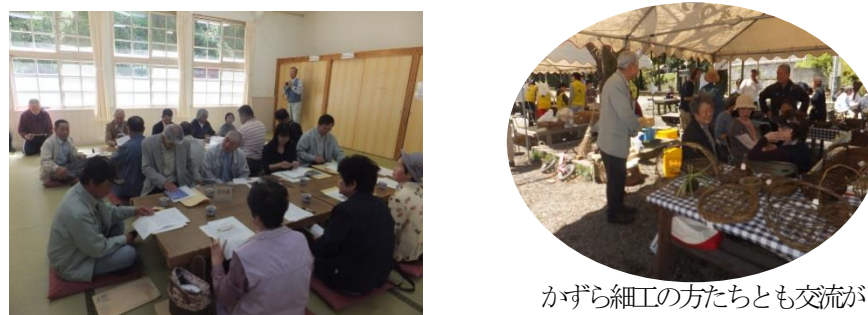
かづら細工の方たちとも交流が...

昨年6月に連合自治会の視察研修で出かけた猪野々自治会の方々が、山菜週間の視察をかねて大保木に来てくれました。初めて来た大保木の印象は、「西条市街からの道も2車線できれいに整備されていて猪野々に比べるとひらけている。」「事業を活発にされている」などなど。「大保木の概要」の説明やふれあいの里の活動について、活発意見交換が行われました。会のあとは「山菜週間」の山菜うどんに舌鼓。「石鎚山の駅」にも寄っていただき大保木を目で舌で肌で感じていただいた視察研修でした。