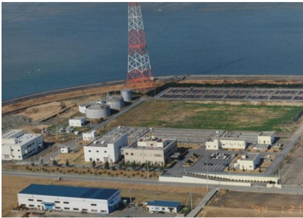
西条浄化センター