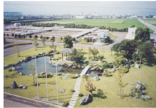
東予・丹原浄化センター