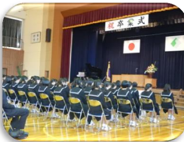
河北中卒業生（男19名、女32名）

日程の都合上、3月24日（木）の庄内小学校と26日（土）の庄内保育所は、当原稿の取材が間に合いませんでしたが、それぞれが4月からの新生活を、しっかりと踏み出してくれることに間違いありません。地域の宝として、夢を抱いて大きく羽ばたいてくださいね。