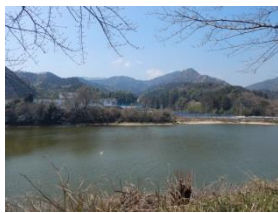
だんのうえこさぶろうきよたか

構築の年代は不明であるが、安政3年（1854）堤かさ上げの記録がある。築堤は元禄との説もある。