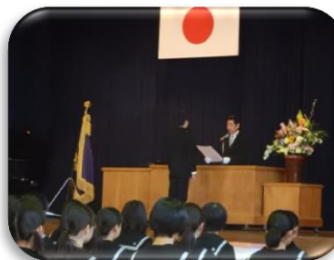
河北中卒業証書授与