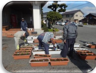
しっかり根付けと願いを込めて。