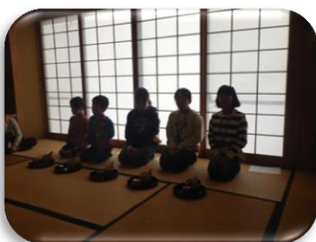
お茶の心を学びます