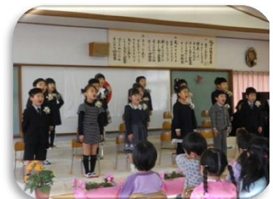
燧洋幼卒園児（男8名、女8名）