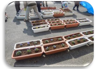
作業の後は心にも花が咲きました。