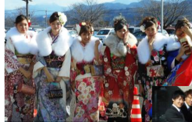
吉井地区新成人 男性12人 女性 7人

式場は、振袖やスーツ姿の新成人が久しぶりに再会した同級生と近況を話したり、記念撮影をしたりと笑顔あふれる華やかな雰囲気になっていました。