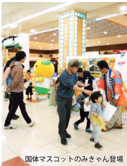
国体マスコットのみきゃん登場