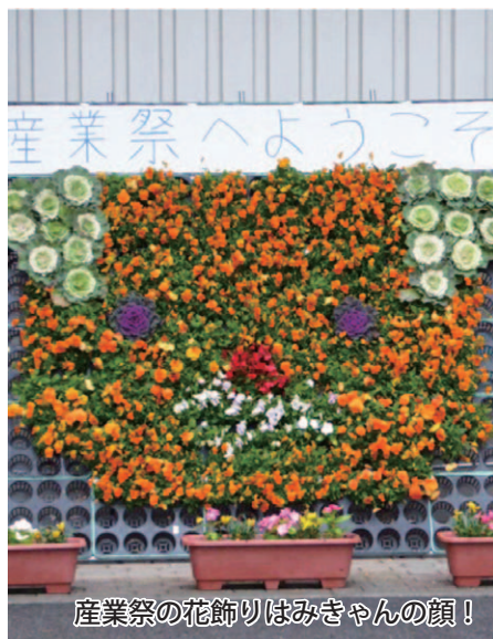
産業祭の花飾りはみきゃんの顔!

2年後に迫った「 えがわ 愛顔つなぐえひめ国体・えひめ大会」をPRするため、10月31日には丹原高校の菊花展で、11月7日・8日にはフジグラン西条で、11月14日・15日には西条市産業祭で啓発活動を実施。菊花展と西条市産業祭では、それぞれの学校の生徒が制作した花飾りが来場者をお迎え。フジグラン西条では、両大会を説明したパネルを展示しました。各イベントには国体マスコットのみきゃんが登場し、イベントを盛り上げました。