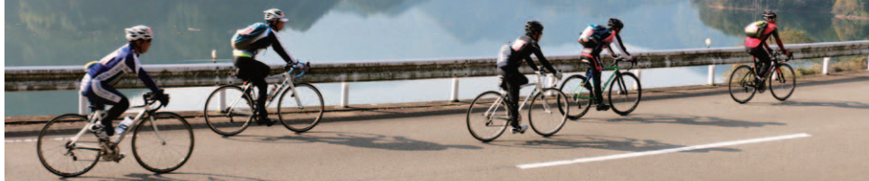
1 大会の様子はFacebookにも掲載 西条市 サイクリング 検索