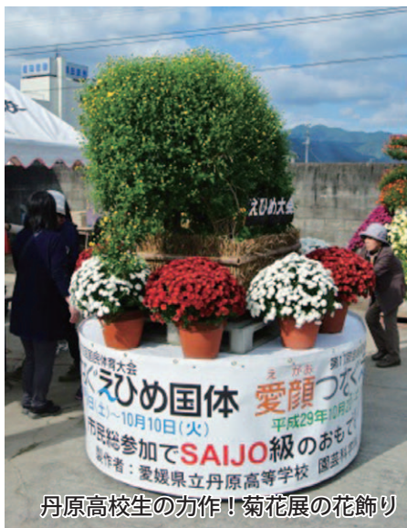
丹原高校生の力作! 菊花展の花飾り