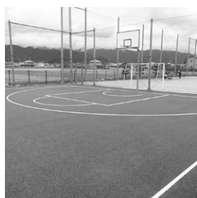
▲改修が終わったバスケットコート