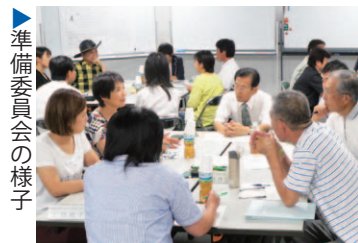
準備委員会の様子

市からの委嘱を受け、ボランティアやNPO法人としてさまざまな分野で活動しているメンバーで構成された開設準備委員会は、昨年度から、どのようなセンターをつくれば市民活動が活性化し、協働によるまちづくりが推進されるのかを検討してきました。このセンターが、「活動に必要な会議や作業などを行うための拠点が無い」「資金や人手の不足だけでなく、交流機会や情報も不足している」といった悩みを抱えながら活動している方や、これから地域で何か活動を始めたいと考えている方にとって、新たな一歩を踏み出すための拠点となることを期待しています。