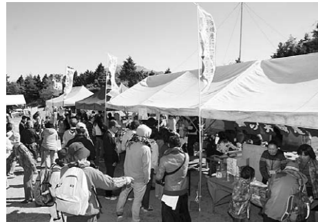
▲石鎚国定公園指定60周年記念事業（山フェス2015ほか）