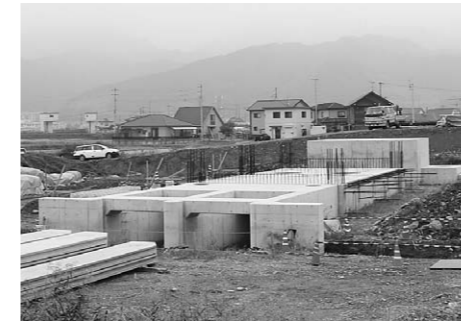
▲古川玉津橋線道路改良事業