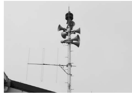
▲防災通信システム構築事業