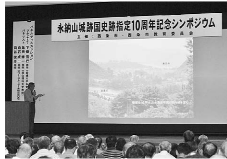
▲永納山城跡シンポジウム開催事業