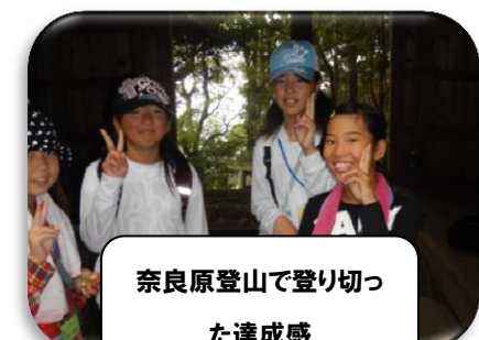
奈良原登山で登り切っ た達成感