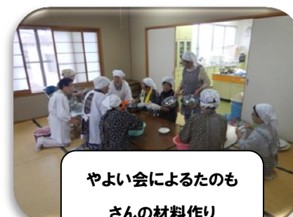
やよい会によるたのも さんの材料作り