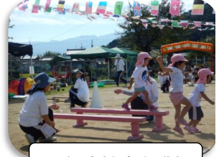
10/3 庄内保育所運動会