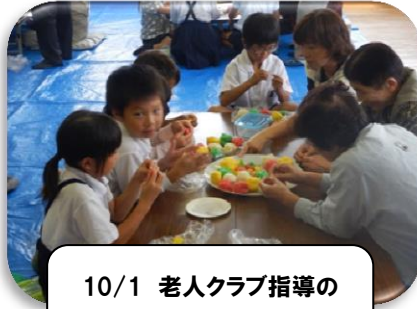
10/1 老人クラブ指導の たのもさん作り