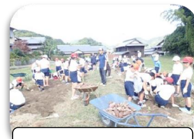
10/13 庄内小さつま芋掘り