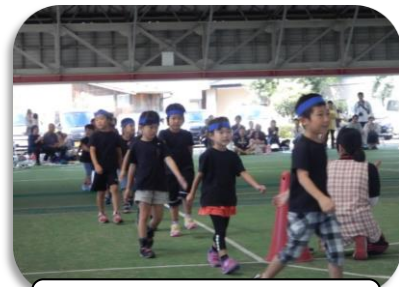
10/3 燧洋幼稚園運動会