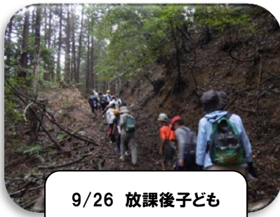
9/26 放課後子ども 教室(奈良原登山)

庄内の子どもたちは、太陽の光を浴びながら、運動に、収穫に、秋祭りにおおいに躍動した1ヶ月でした。次は、文化の秋、紅葉の秋、味覚の秋、そして、年越しに向けた準備の晩秋に入ります。