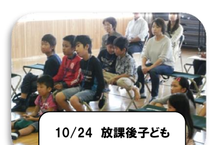
10/24 放課後子ども 教室(読み聞かせ)