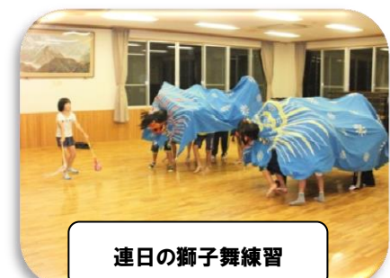
連日の獅子舞練習