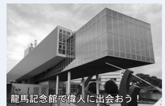
龍馬記念館で偉人に出会おう!