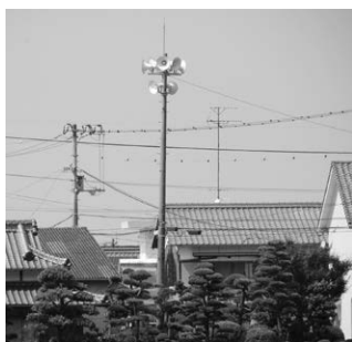
▲整備された新田自治会の放送施設