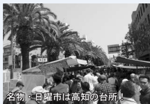
名物・日曜市は高知の台所!

■申込方法 往復はがきに申込者全員(1枚2人まで)の住所、 ふりがな 氏名・年齢・電話番号を明記し、申込先までお送りください。