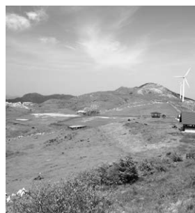
▲久万高原町に広がる風景の写真