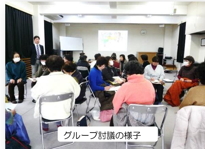
グループ討議の様子

性的少数者がひとりの人間として尊重されなければならないのは、当たり前のことです。