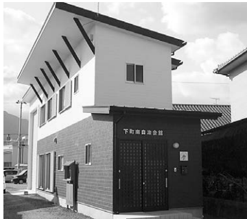
▲完成した下町南集会所

このたび平成26年度の助成を受けて、下町南集会所が完成しました。今後の活発なコミュニティ活動の拠点となることが期待されます。