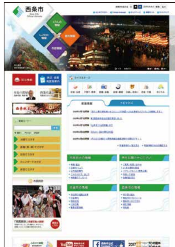
新しくなった西条市ホームページ