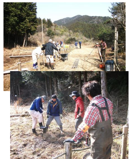
上：測量 下：湿地整備

ハッチョウトンボは県の特定希少野生動植物(絶滅危惧類)に、また、県内では当地のみが特定希少野生動植物保護区に指定されており、成虫は体長20mmの超ミニトンボで、環境調査の指標昆虫のひとつに選定されています。