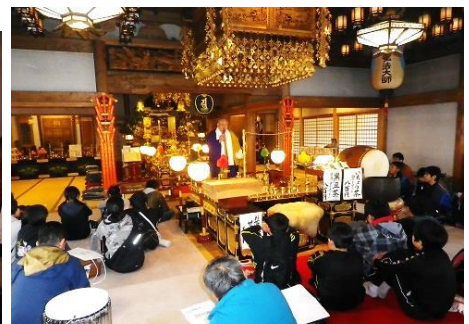
左：永納山城跡説明 中：自己紹介 右：世田薬師住職講話