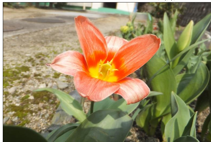
“チューリップ” 咲きました！