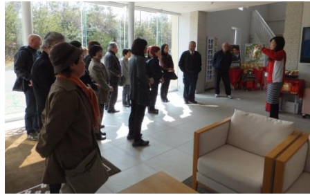
大塚製菓板野工場

好天で暖かな日差しを浴びながら、19名の皆さんで大塚製菓板野工場と四国霊場3番札所の金泉寺、脇町のうだつの町並みの歴史を学びました。大塚製菓板野工場は、人と環境にやさしい工場をテーマに自然のままの大地の起伏と自然林を残した公園スタイルとなっており、SOYJOYとソイカワの製造工程を見学、手軽に摂れる栄養食品であり非常食にもなるそうです。