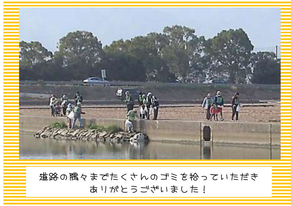
道路の隅々までたくさんのゴミを拾っていただきありがとうございました!

最後にお待ちかねの順位発表とピンゴゲームを行い、無事終了することができました。みなさまお疲れ様でした!