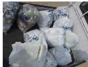
空き缶や可燃ゴミなど軽トラ1台分の不要物が回収されました