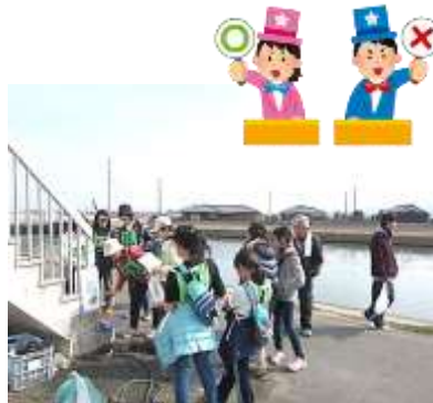
途中にあるクイズも解きながら...