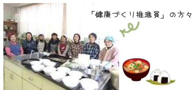
昼食は「健康づくり推進員」さんの作ったおいしい豚汁とおにぎりをいただきました!