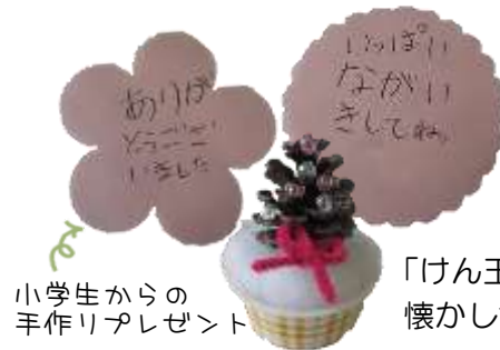
小学生からの手作りプレゼント