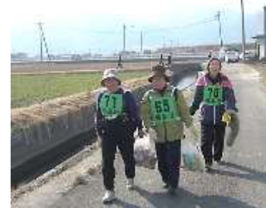
袋いっぱいゴミを拾ってくれました!