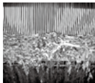
スクリーンで除去した野菜くず（上）写真、下水処理場に流入したポール状の油（下）写真

除去するごみの量が増加すると処理費用も増加するため、野菜くずなどのごみは下水道に流さないようにしましょう。また、汚水中には油も含まれてきます。油は下水の処理機能に支障をきたすだけでなく、固まれば下水管の閉塞の原因になるので、家庭での食器の油汚れはふき取って洗い、大量に油が残った場合は、凝固剤で固めるなどして廃棄物で処分するようにしましょう。