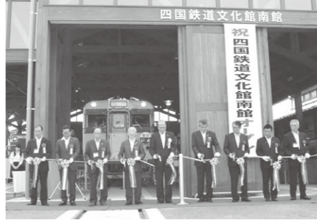
▲四国鉄道文化館南館整備事業