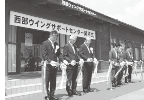
▲西部ウイングサポートセンター整備事業