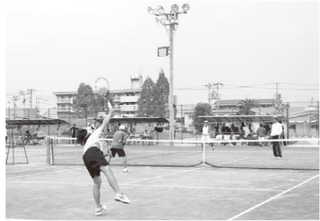
▲第2期中央地区まちづくり基盤整備事業（市民公園テニスコート ほか）