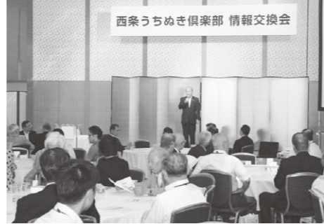
▲西条うちめき倶楽部推進事業