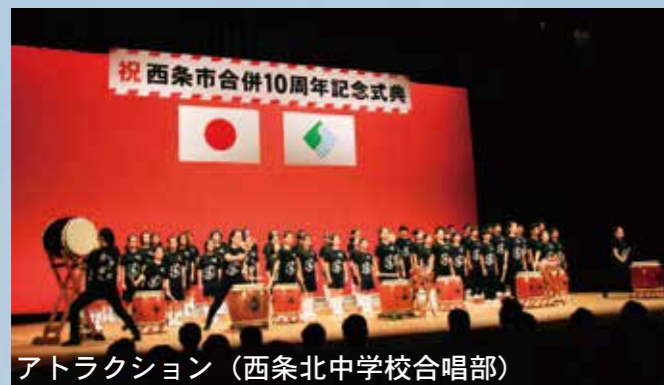
アトラクション (西条北中学校合唱部)