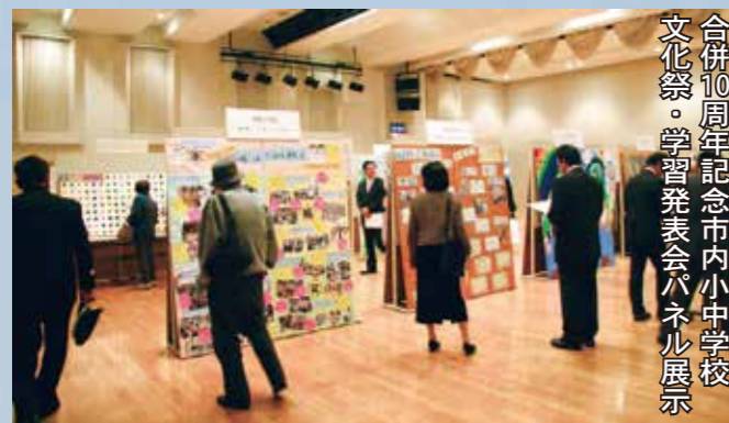
合併10周年記念市内小中学校文化祭・学習発表会パネル展示