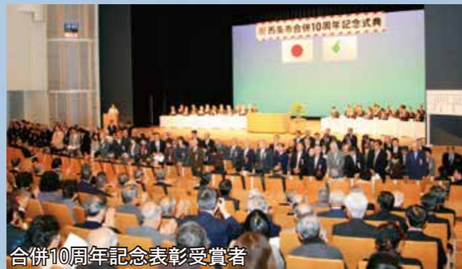
合併10周年記念表彰受賞者