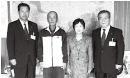
おめでとうございます。