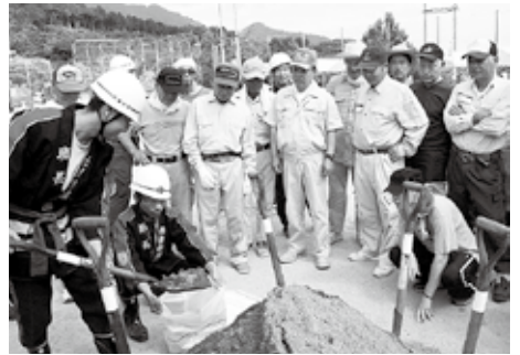
▲市民総合防災訓練実施事業（丹原総合公園）