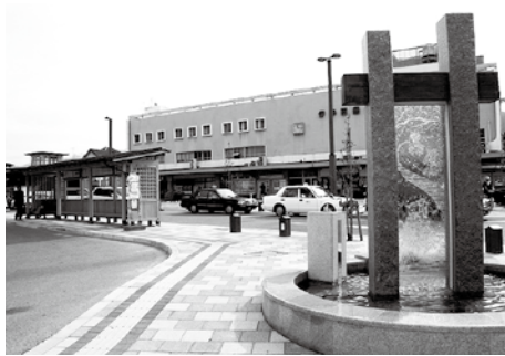
▲まちづくり基盤整備事業（西条駅周辺整備）