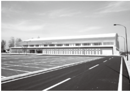
▲東予運動公園整備事業（屋内体育施設）