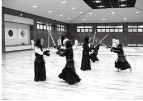
▲小松武道館改修事業

市では、皆さんに市の財政状況を知っていただくため、年に2回、各会計の執行状況などを公表しています。今回は、平成20年度上半期（4月1日～9月30日）の財政状況について、お知らせします。