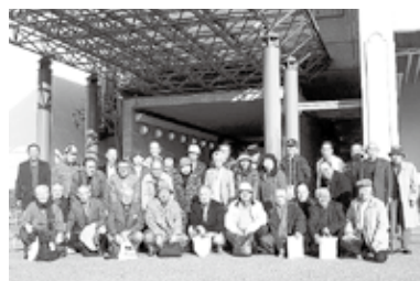
四国鉄道OB会 (香川県高松市)

永年にわたり、自治会等の要職にあつて、地域福祉やコミュニティ活動の推進に貢献されました。