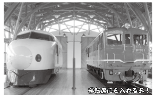
運転席にも入れるよ!