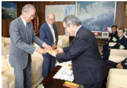
▶ 市長からもみじマークの贈呈

また、6月2日からの無料配布には、多くの方が標識を受け取りに来庁されました。（写真下）